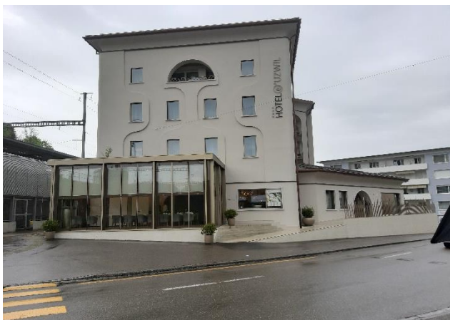
Luogo dell'incontro conferenza dei presidenti e assemblea: Hotel Uzwil